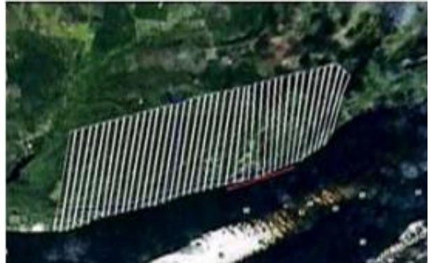
Imagem 2: Distribuição dos lotes.