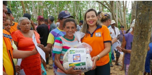
Imagem 5: Segunda entregar de cestas básicas.