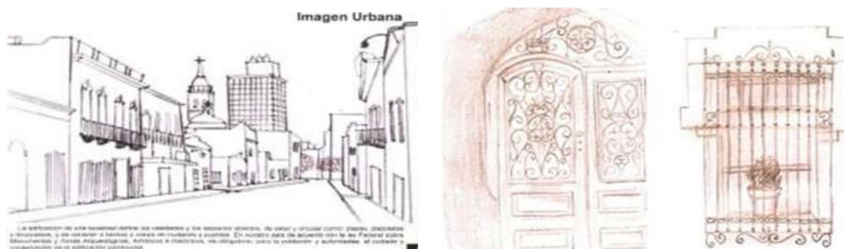
Fig. 6. Se destacan detalles de herrería, señalética con herrajes, balcones, faroles, como elementos tipológicos del barrio antiguo.

Esta normatividad, nutrida por los elementos tipológicos analizados, asegura la permanencia de elementos esenciales en la arquitectura urbana.