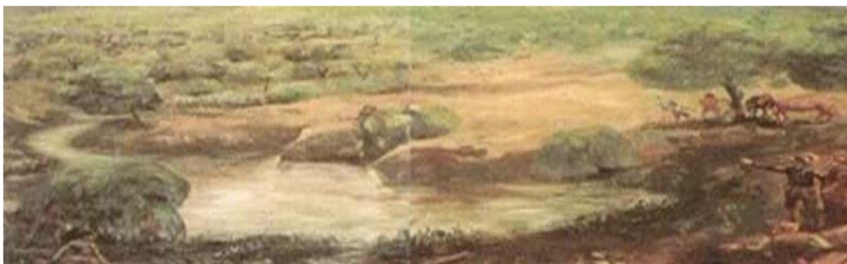
Fig.1. Pintura del valle de Santa Lucía en la primera fundación de Monterrey por Alberto del Canto. colección privada.