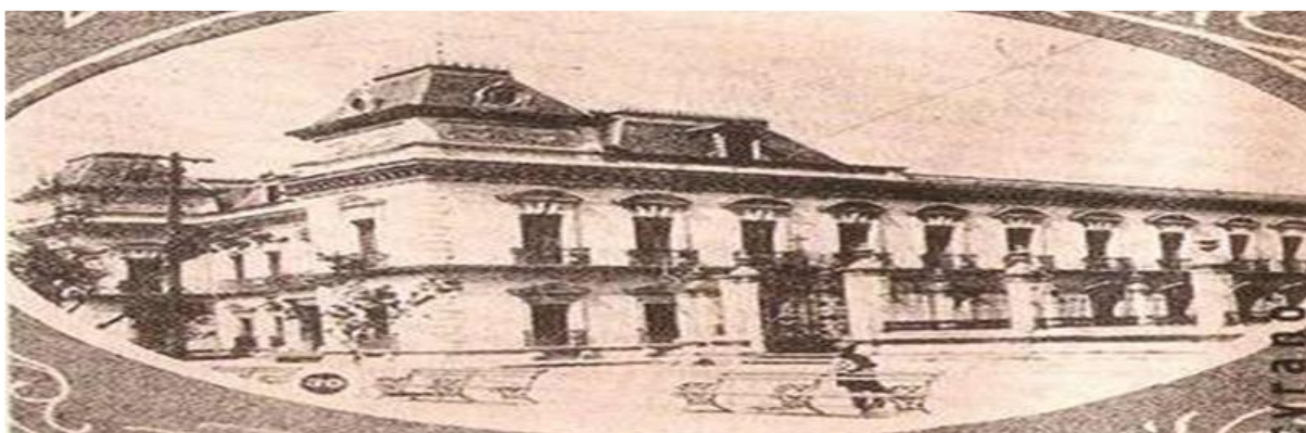
Fig. 2. Casa del gobernador José María Ortega. llamada la “Casa de las águilas” actualmente existe y se encuentra ubicada en el barrio antiguo.

cien manzanas sumaban cuarenta mil habitantes abastecidos por 3 tiendas de abarrotes, una farmacia, una funeraria y varias panaderías y carnicerías señaladas por banderas rojas que izaban a sus puertas. Martín de Zavala hijo fundó en Monterrey la Villa de Cerralvo. Delimitó la ciudad, estableciendo como límites la cuesta de los Muertos, colindantes con Coahuila, extensión de tierra que con el paso de tiempo se fue reduciendo al cobrar importancia las haciendas y estancias ubicadas en ella. El municipio de Monterrey limita al norte con los municipios de San Nicolás de los Garza y General Escobedo, al sur con San Pedro Garza García y Santiago. Al este con Guadalupe y Juárez y al oeste con Santa Catarina y García. (Cavazos Garza, 1960:96).