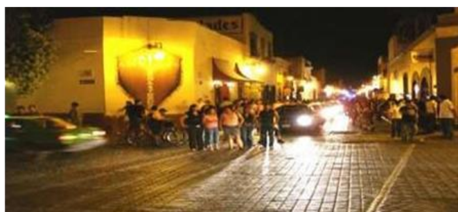
Fig. 5. Bares localizados en el barrio antiguo a lo largo de la calle Padre Mier y Morelos estos espacios a funcionar desde el miércoles hasta el domingo de la madrugada.